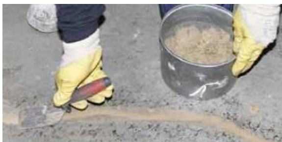
Рисунок 6. Выравнивание поверхности и трещин при помощи средства MasterInject /MasterFlow.

соответствующий эпоксидный состав из серии MasterBrace/MasterFlow для ее выравнивания. В случае отсутствия готового материала для герметизации на месте, приготовьте смесь, используя MasterInject 1360 и сухого чистого кварцевого песка и заполните штрабу этой смесью, рис.6.