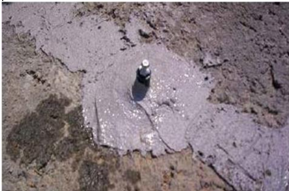
Рисунок 2. Герметизация пакера, установленного на поверхности и трещины при использовании соответствующего средства

Расположение пакеров необходимо определить перед установкой. В зависимости от размера трещины инъекционные пакеры необходимо установить на расстоянии 15 – 50 см друг от друга по всей длине трещины. Для закрепления пакера к бетону нанесите небольшое количество необходимого эпоксидного состава/ шпатлевки MasterBrace/MasterFlow вокруг основания пакера. Начинайте устанавливать пакеры с одного конца трещины и повторяйте эту операцию, пока трещина не будет пройдена вся. Необходимо тщательно нанести эпоксидную шпатлевку вокруг основания пакера, и закрыть саму трещину слоем состава не менее 3 мм. Герметизацию производить при помощи соответствующего эпоксидного состава/ шпатлевки MasterBrace / MasterFlow или используйте материалы MasterSeal 590/ MasterFlow 920 AN при необходимости проведения быстрых работ по инъектированию (через несколько часов после герметизации трещины и пакеров). Рекомендуется, чтобы уплотнение колпачка имело толщину не менее 3 мм и ширину 6-8 см при использовании материалов на эпоксидной основе, при использовании средства Masterseal 590 толщина должна быть более 10 мм. рис. 2.