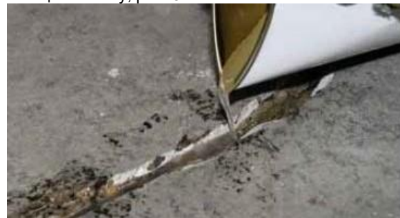
Рисунок 5. Заливка MasterInject 1360 непосредственно в V-образную штрабу на трещине

Начинайте нанесение сразу, как только материал будет готов после надлежащего смешения. Это – обязательное условие для обеспечения возможности более длительного времени жизни с целью обеспечения лучшего проникновения. Залейте смешанный состав MasterInject 1360 в V-образную штрабу на месте трещины. Дайте смоле проникнуть в трещину и продолжайте заполнять трещины до тех пор, пока они больше не смогут вмещать смолу, рис. 5.