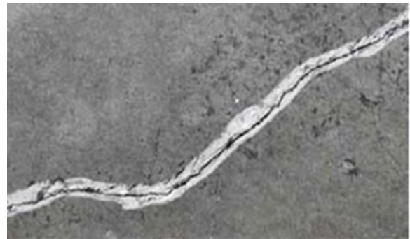
Рисунок 3. V-образная канавка вдоль трещины

В случае малой прочности бетона/ очень слабого подстилающего слоя, необходимо расширить трещину в форме V-образной канавки вдоль трещины, рис. 3.